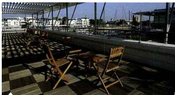
L'Espace Encan offre 10 000 m 2 au bord du bassin des Grands Yachts

À l'Est de Rochefort entre terre et mer, l' Abbaye Royale de Saint-Jean-d'Angely (fondée au IX e siècle), aujourd'hui classée monument historique compte 37 chambres et divers espaces privatisables (de 50 à 250 p), sa Cour du cloître (1 300 m 2 ) attenante à l'abbatiale, les ateliers qui occupent les anciens celliers à vin, greniers à sel, écuries, boulangeries pour de petites réunions (30 à 40 personnes), le service restauration (de 15 à 300 couverts) est assuré par un traiteur au choix →