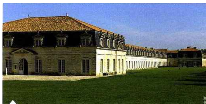
La Corderie Royale de Rochefort abrite le chantier de reconstruction de L'Hermione

Sur l'île de Ré, l' Hôtel Atalante Relais Thalasso 4* (106 ch.), établissement du groupe Phelippeau entièrement rénové en 2010, s'étend sur 5 ha de domaine, entre vigne et océan, à Sainte-Marie-de-Ré (2 restaurants – un gastronomique et un bio diététique – un centre de thalassothérapie avec package découverte séminaires, 4 salles jusqu'à 130 p.) ; le Relais & Châteaux Le Toiras 5* (20 ch.), ancienne demeure d'armateur à l'architecture typiquement rhétaise, domine le port de Saint-Martin-de-Ré (salle jusqu'à 20 p. en séminaire) et voit son offre confortée avec la Villa Clarisse (9 ch. et suites), hôtel particulier classé du XVIII e , en élégante annexe à 3 min à pied. À La Flotte-en-Ré, s'est installé le Le Richelieu Thalasso & Spa 4* Luxe (40 ch., salle modulable de 100 p.).