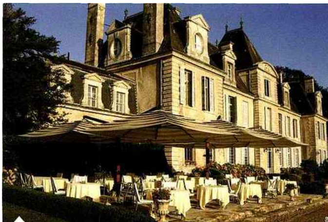
Grégory Coutanceau a repris La Cédraie, le restaurant réputé du Château de Curzay

800 convives du dîner de gala d'Al-lande (Ingerie) à l'Espace Encan, suite au défilé de mode présentant la nouvelle collection printemps-été 2013. Boulimique de découvertes et d'expériences, il a également créé en 2012 La Classe des Gourmets, une école de cuisine et de sommelier, toujours à La Rochelle, afin de pouvoir transmettre son savoir, et dans la foulée il a repris La Cédraie, le restaurant réputé du Château de Curzay, récompensé cette année par une étoile au Guide