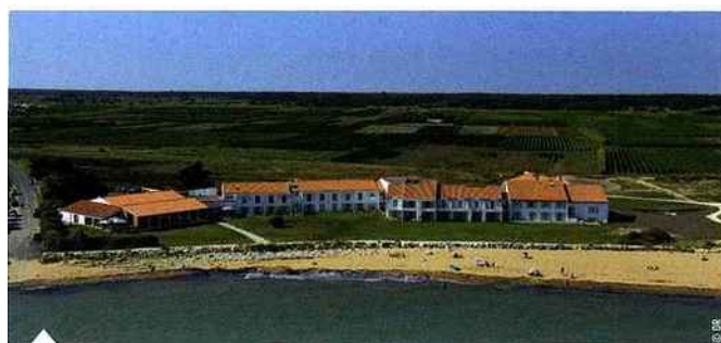
Hôtel Atalante Relais Thalasso 4* à l'île de Ré