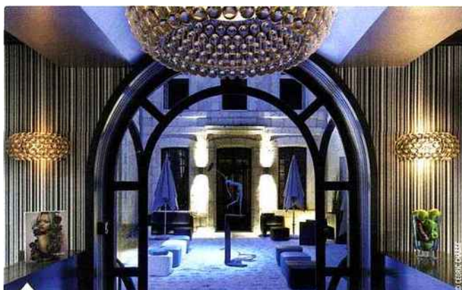
Le Monnaie Art & Spa Hôtel occupe une ancienne demeure du XVII e siècle

moins pléthore d'établissements de charme, parfois très contemporains, toujours chaleureux.