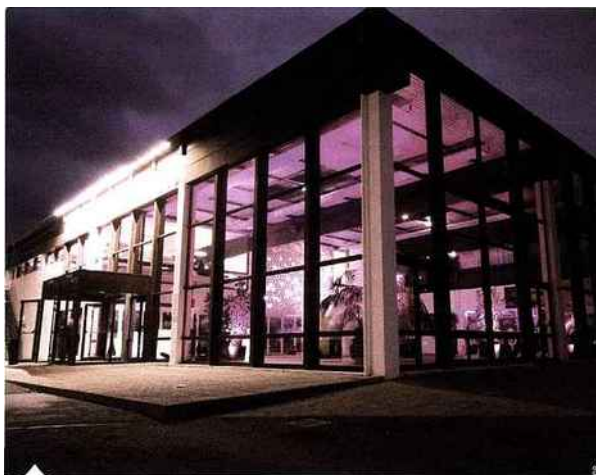
Le Forum des Pertuis, l'un des deux lieux gérés par La Rochelle Événements

Autant de possibilités d'activités nature qui, ici, ne s'appuyant pas uniquement sur le littoral, permettent aux acteurs du tourisme d'affaires de belles combinaisons entre terre et mer, pour un dépaysement unique. Autre avantage, celui de la taille humaine de ses pôles urbains. À La Rochelle, par exemple (80 000 habitants), nul besoin de transfert en ville, tout peut se faire à pied, en quelques minutes, ce qui pour les participants à une manifestation, renforce encore la sensation d'un village où il est aisé de se retrouver et de partager. La Rochelle Événements , qui gère les deux espaces de congrès de la ville (Espace Encan et Forum des Pertuis), mobilise nombre de professionnels afin d'inscrire la destination parmi les places incontournables du Mice. Elle aura d'ailleurs accueilli, pour la première fois, du 16 au 18 janvier dernier, la réunion annuelle de France Congrès, après avoir obtenu la double certification, Charte qualité et développement durable et Iso 9001.