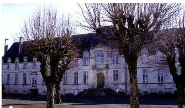
Abbaye Royale de Saint-Jean d'Angely