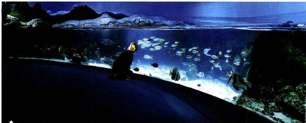
En plus de ses 12 000 animaux, l'Aquarium de La Rochelle est doté d'un tunnel à 360° entièrement vitré