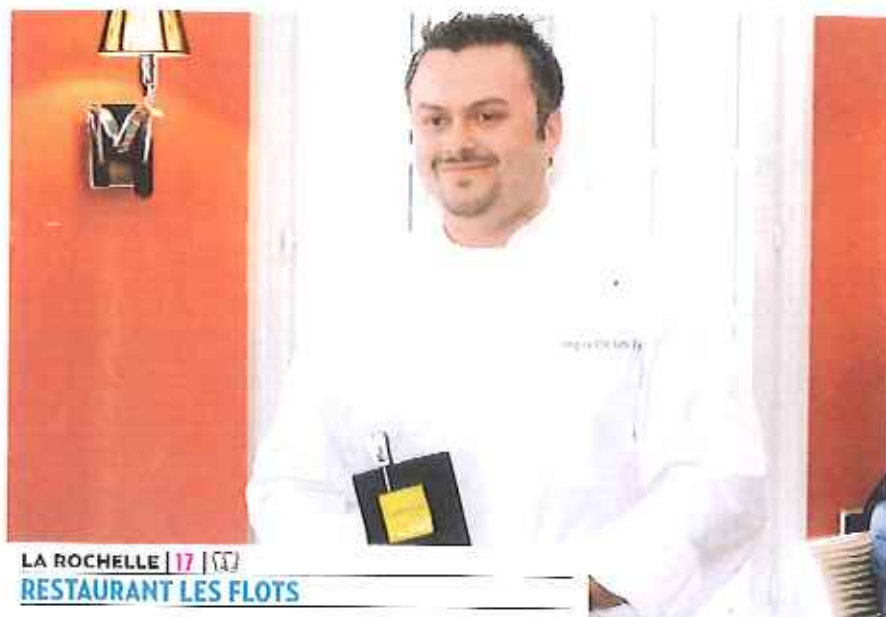
LA ROCHELLE | 17 | ☎ RESTAURANT LES FLOTS

ITOU-CHARENTES 1 Charente 1 Charente-Maritime 1 Deux-Sèvres 1 Vienne