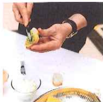
Un verre composé, c'est tendance !

Les nouvelles des restaurateurs de la région.