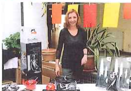
Staub sortait ses cocottes.