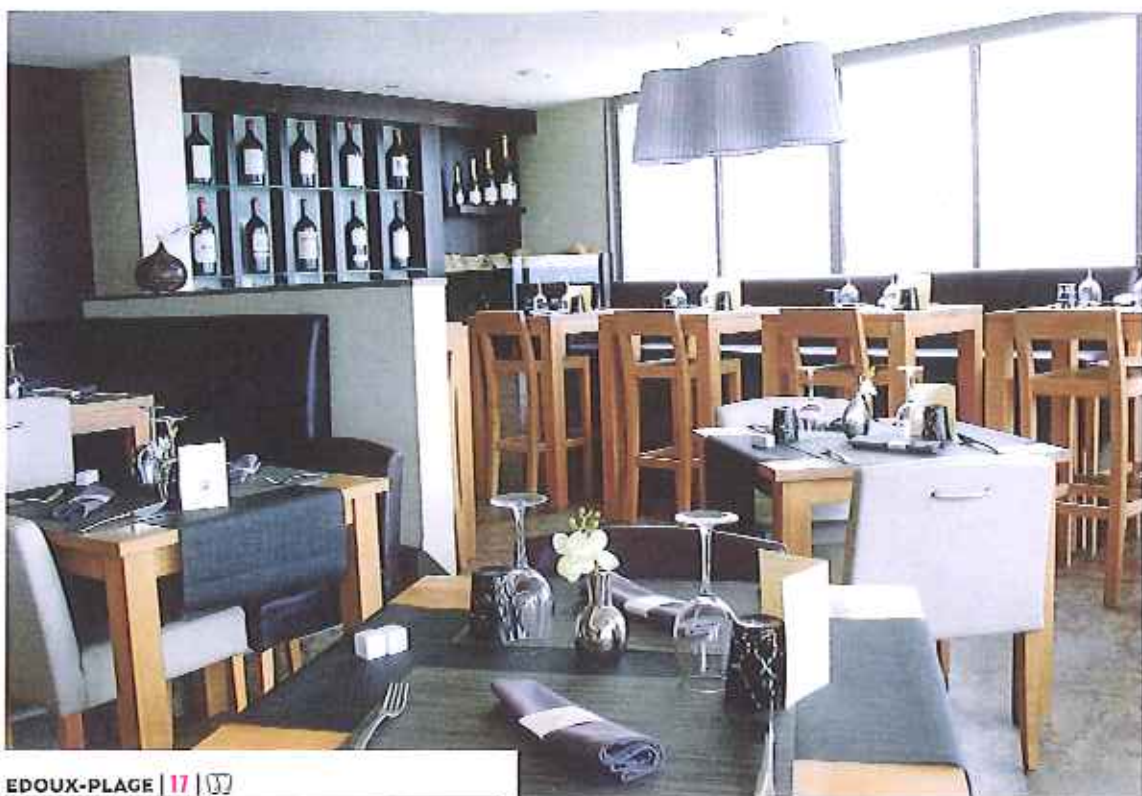
EDOUX-PLAGE | 17 | ☎