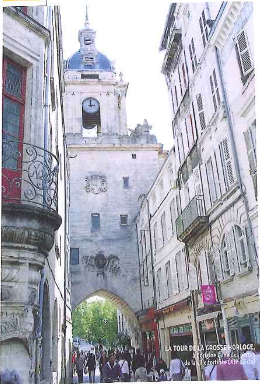
LA TOUR DE LA GROSSE HORLOGE, à l'origine l'une des portes de la ville fortifiée (XII e siècle)

La plupart des chefs rochelais d'aujourd'hui ont su faire prospérer ce patrimoine, grâce aux trésors locaux et ceux qu'ils ont trouvés dans les cambuses des vaisseaux : les huîtres de Marennes-Oléron, les moules de Charron, les langoustines et les sardines, et les poissons atlantiques tant appréciés, le bar et le maigre, les merveilleux petits cétéaux et la sole de Courreau. La tradition leur a enseigné le respect du naturel et la subtilité des épices, les plats de convivialité, l'éclade que l'on prépare sur les aiguilles de pin sur la plage, ou la chaudière conviviale que l'on partage en famille. Les compositions, au fil du temps, et selon la personnalité de chacun, s'affinent et se multiplient, utilisant les dernières modes (la cuisson plancha notamment) pour être toujours plus près du produit. Un trait de curcuma, un brin de coriandre, quelques grains de poivre de Madagascar ou de Sarawak et le plat devient vraiment rochelais, chaque corsaire qui sommeille sous la toque s'appropriant le coin d'océan qui lui convient.