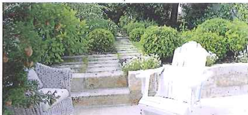
CI-DESSOUS : Dans le jardin de la maison d'hôte Entre Hôtes.