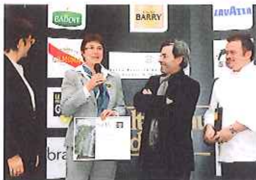
Prix « Transmission et Culture » des Cercles Culinaires.