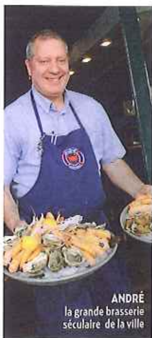
ANDRÉ la grande brasserie séculaire de la ville